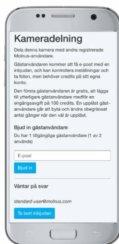
Dela dina kameror med dina vänner och ta del av deras.