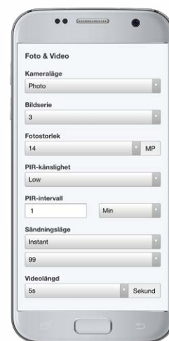
Kontrollera alla inställningar för din kamera direkt från Molnus.