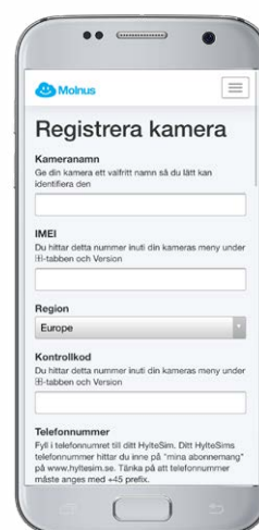
Registrera nya kameror direkt i appen.